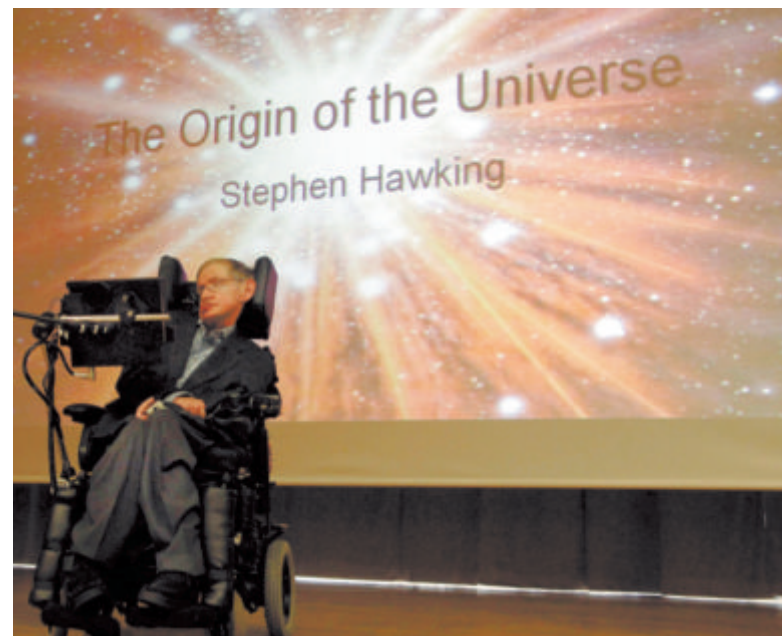
Der Physiker Stephen Hawking steuert über einen Infrarotsender in seiner Brille einen Sprachcomputer.